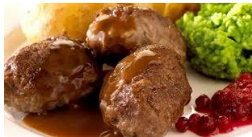
Kjøttkaker i brun saus